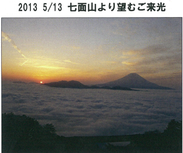
2013 5/13 七面山より望むご来光